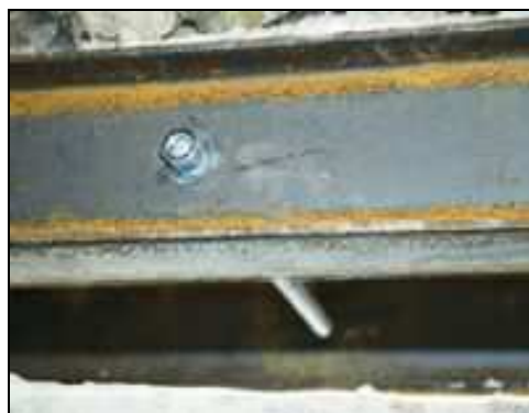
Połączenie skręcane belek stalowych nadproża

W trakcie wykonywania robót remontowych polegających na powiększaniu światła otworów drzwiowych, należy zwracać uwagę, aby otwór po wykończeniu i osadzeniu ościeżnicy posiadał wymagane wymiary.