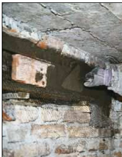
Belki stalowe wypełniono cegłą i obetonowano

Belki nadprożowe po osadzeniu należy następnie wypełnić cegłami, owinąć siatką Ledóchowskiego lub Rabitza oraz obetonować.